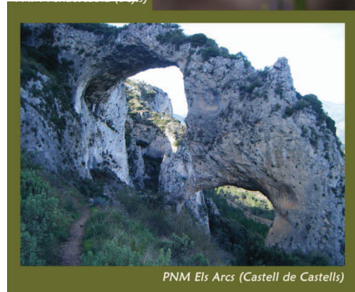
PNM Els Arcs (Castell de Castells)