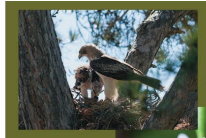
(Castellfort, Cincorres, Portell de Morella)