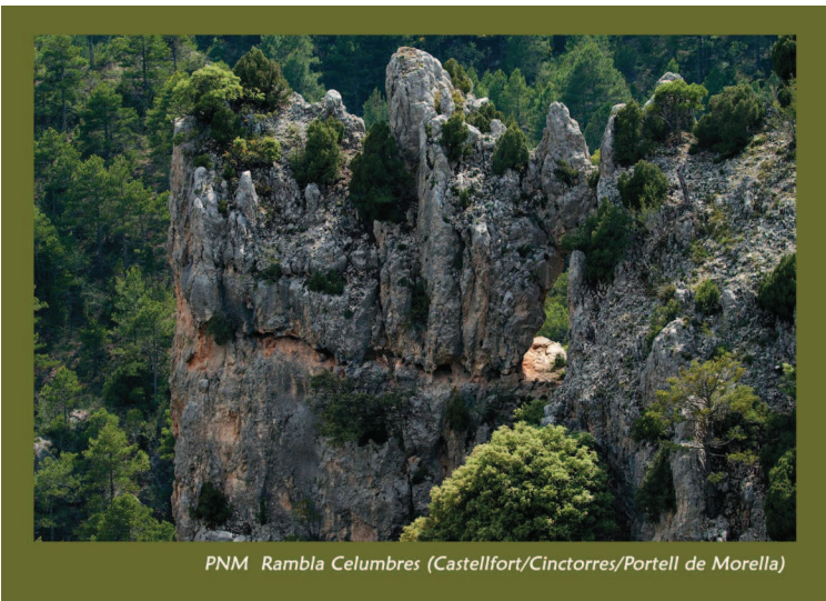
PNM Rambla Celumbres (Castellfort/Cincorres/Portell de Morella)