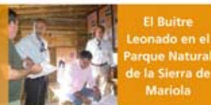
El Buitre Leonado en el Parque Natural de la Sierra de Mariola

Desde el año 2000, FAPAS-Alcoi lleva a cabo un proyecto de reintroducción del Buitre Leonado ( Gyps fulvus ) como especie nidificante en las comarcas centrales de la provincia de Alicante a partir de una población fijada en el Parc Natural de la Serra de Mariola.