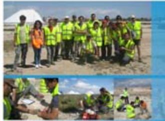
Colaboración entre la empresa privada (NCAST) y asociación conservacionista (AHSA) en la protección de una especie en peligro de extinción, la Gaviota de Audouin

AHSA, es una Asociación conservacionista fundada en el año 1995 con el objetivo de promover actividades para la conservación, estudio y divulgación de los valores naturales y paisajísticos de los humedales del sur de Alicante. Su ámbito de actuación, son las tres comarcas del sur de Alicante.