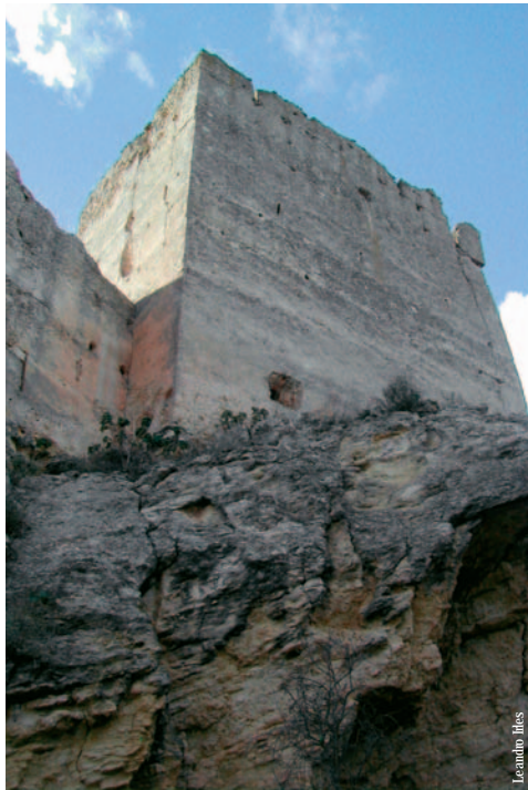
Castillo de Barxell, Alcoy

entidad promotora: Diputación de Alicante