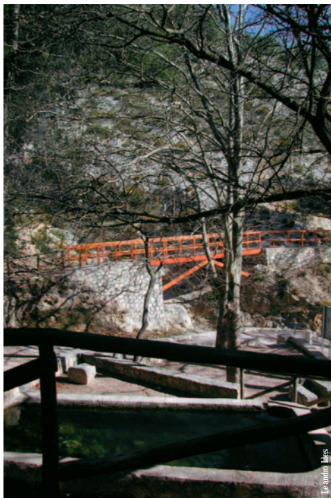
Àrea recreativa de Sant Cristòfol, el Preventori, Alcoy

entidad promotora: Ayuntamiento de Alcoy