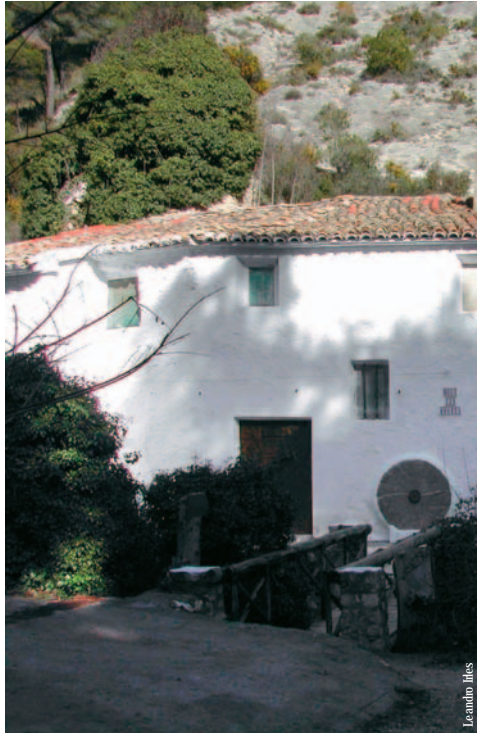
Molino en el barranco de los Molinos, Ibi