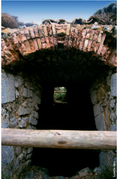
Cava del Canyo, Ibi

entidad promotora: Diputación de Alicante