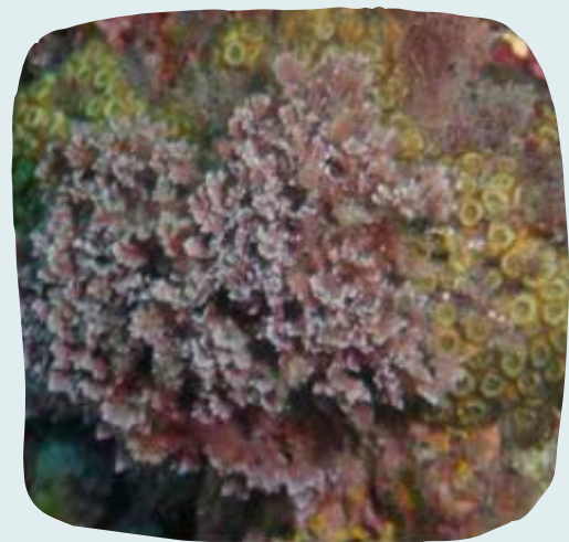
Colònia o coral de Cladocora caespitosa amb part central necrosada a causa de l'acidificació.

En la Reserva Marina també podem trobar prades de fanerògames com a Posidonia oceanica i la més abundant Cymodocea nodosa , formant ecosistemes que poden albergar una immensa vida. Per exemple, en el cas de Posidonia oceanica , una hectàrea d'aquesta planta captura més CO 2 i emet 5 vegades més oxigen que la mateixa superfície de selva amazònica, a més de crear un ecosistema capaç d'albergar fins a 400 espècies de plantes i 1000 d'animals (2).