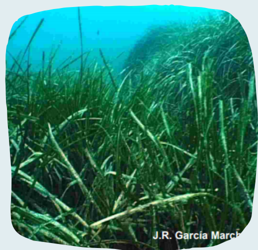
Prada de Posidonia oceanica . J.R. García March