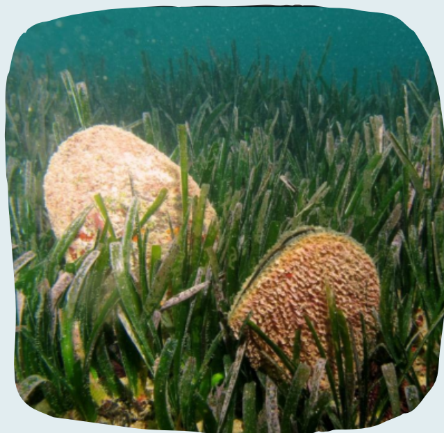
Pinna nobilis habitant en prada de Posidonia oceanica .

D'ací la gran importància de protegir aquests ecosistemes, ja que aquesta planta només es troba en el Mediterrani i podríem dir que és un gran aliat per a lluitar contra l'acidificació de les mars, el calfament global i el canvi climàtic. Ser molt interessant i amenaçat de la nostra Reserva, que a més és endèmic del Mediterrani, és la nacra, i es troba principalment en les prades de Posidonia oceanica . La Pinna nobilis és considerat el mol·lusc bivalve més gran de tota Europa, aconseguint 120 cm de longitud i també molt longeu, podent viure fins a 50 anys.