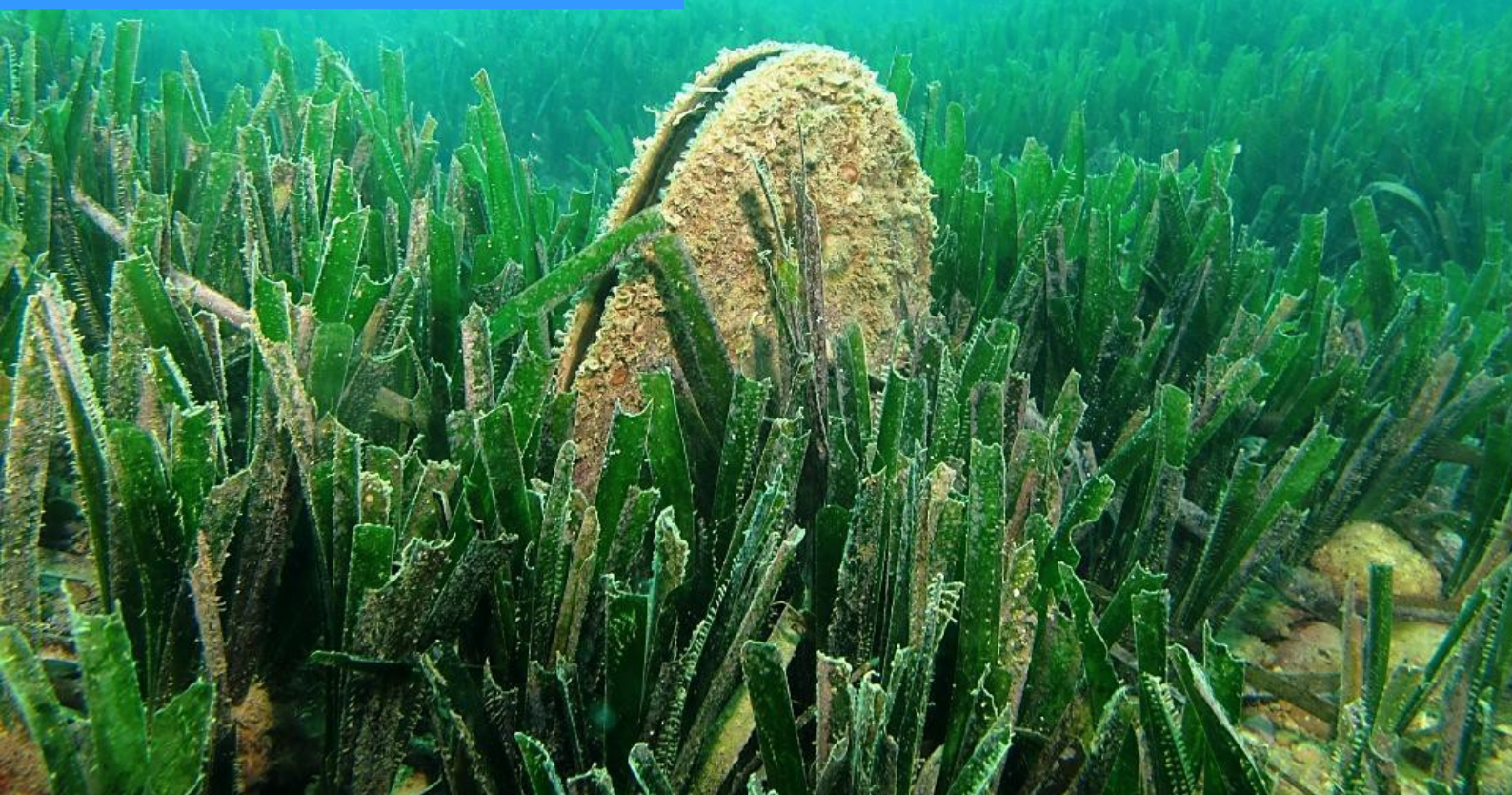
Foto: Hàbitats de Posidonia oceanica : cens de nacra, 2012. Conselleria d'Infraestructures, territori i medi ambient amb Obra social La Caixa.