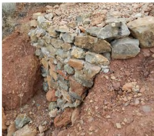
Exemple de millora de ferm en pista forestal