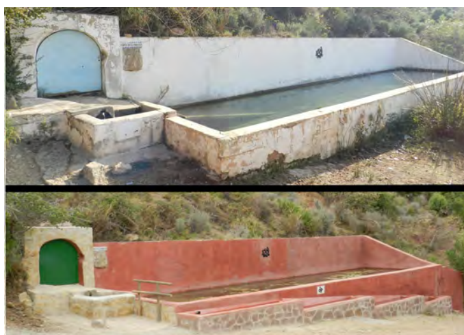
Font de l'Abella

Per últim, enguany hem invertit un temps en revisar i inventariar les caixes niu que tenim a la serra.