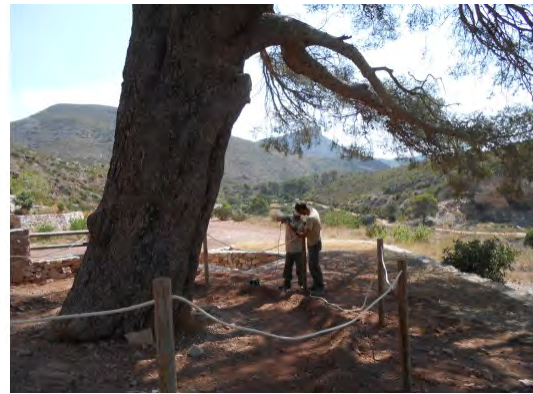
Tanca protectora perimetral Pi del Salt

La resta d'àrees recreatives del parc natural, excepte en un període curt de temps, han estat gestionades per unes brigades especials adscrites a la Direcció General del Medi Natural.