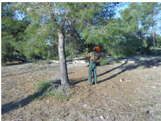
Podas en altura amb pèrtiga