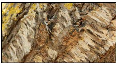
Dues xibemes en acció/ Dos clicheras en acción