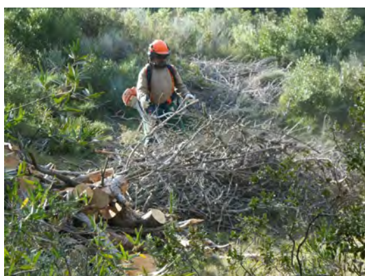
Treballs amb desbrossadora