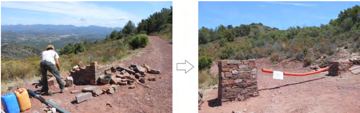
Columna de pedra per evitar que trenquen l'entrada a l'àrea recreativa del Garbí