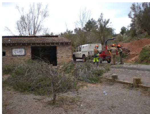
Treballs amb biotrituradora