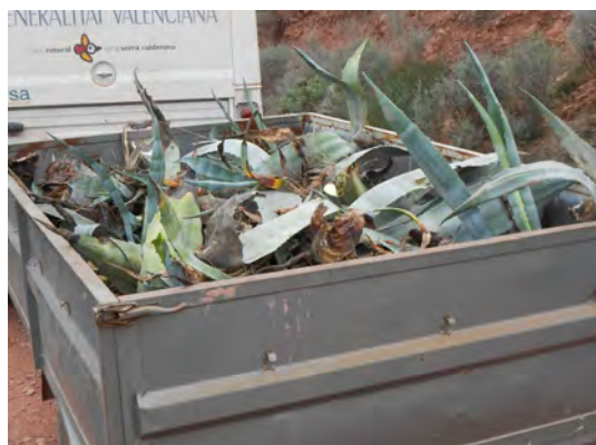
Eliminació de piteres