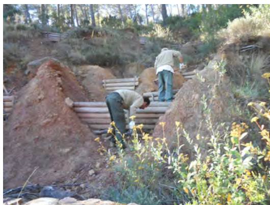
Xaragalls (càrcava) en la font del Llentiscle