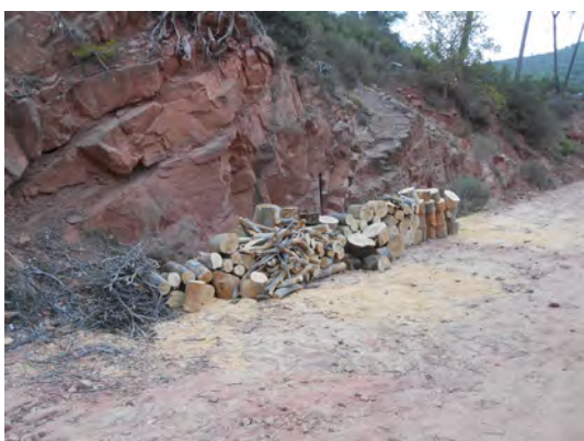
Disposició de les restes vegetals en la vora del camí per a l'aprofitament dels veïns