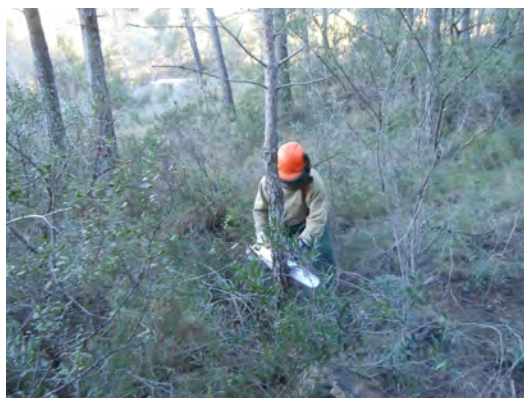
Treballs amb motoserra