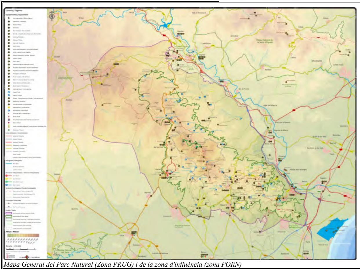
Mapa General del Parc Natural (Zona PRUG) i de la zona d'influència (zona PORN)