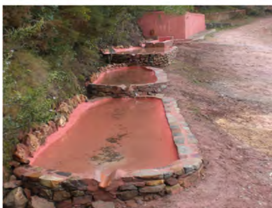
Font del Berro