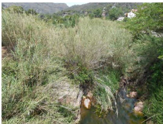
Eliminació de canya al Carraixet