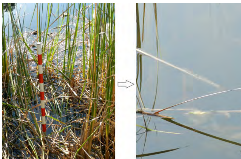
Barra de mesura de profunditat 10 novembre 2016-gener 2017

L'equip del parc natural en coordinació amb els agents mediambientals, començarà el 2017 a prendre mostres d'aigua de les llacunes per a integrar la informació en una base de dades que de moment és interna de la Conselleria però que en un futur s'espera que pugui estar en línia a la disposició de tots els interessats.