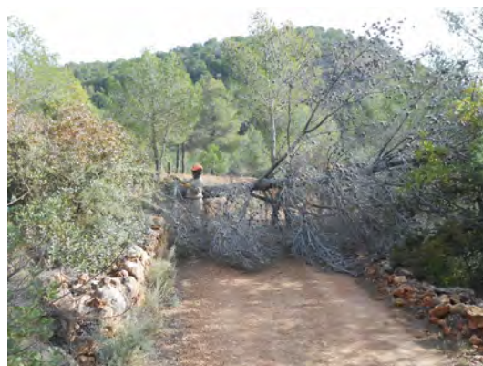
Eliminació d'arbres morts o caiguts