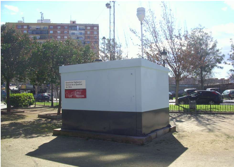
Foto: Estación València-Pista de Silla

También se lleva a cabo el análisis de metales como el Arsénico, Níquel, Cadmio y Plomo en la fracción PM 10 , así como del benzo(a)pireno y otros hidrocarburos aromáticos policíclicos.