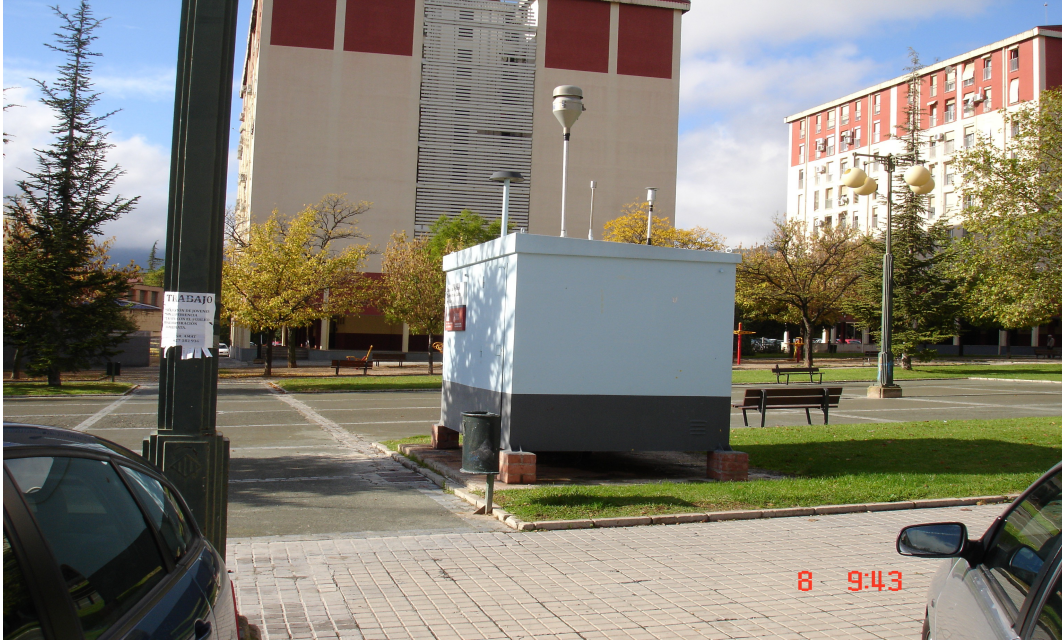
Foto: Estación de ALCOI-VERGE DELS LLIRIS

También se lleva a cabo el análisis de metales como el Arsénico, Níquel, Cadmio y Plomo en la fracción PM 10 , así como del benzo(a)pireno y otros hidrocarburos aromáticos policíclicos.