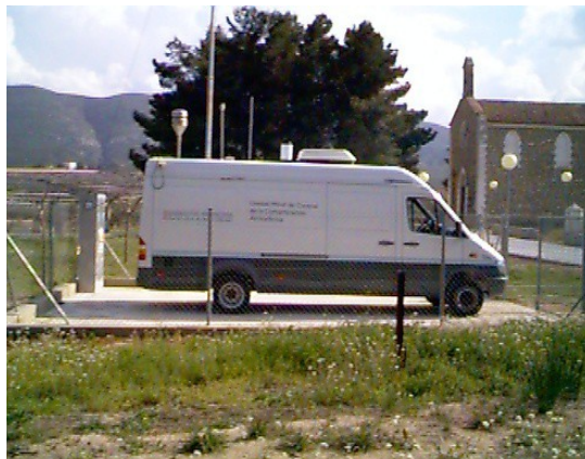
Foto: Unidad Móvil de ONTINYENT

La Red Valenciana de Vigilancia y Control de la Contaminación Atmosférica cuenta con tres unidades móviles y una Unidad de Intervención Rápida, las cuales, obtienen información sobre 11 emplazamientos repartidos en el área interior de la Comunidad Valenciana