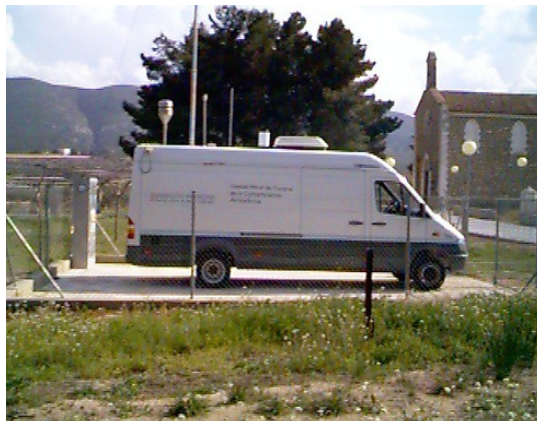
Foto: unidad Móvil de ONTINYENT

La Red Valenciana de Vigilancia y Control de la Contaminación Atmosférica cuenta con tres unidades móviles y una Unidad de Intervención Rápida, las cuales, obtienen información sobre 11 emplazamientos repartidos en el área interior de la Comunidad Valenciana