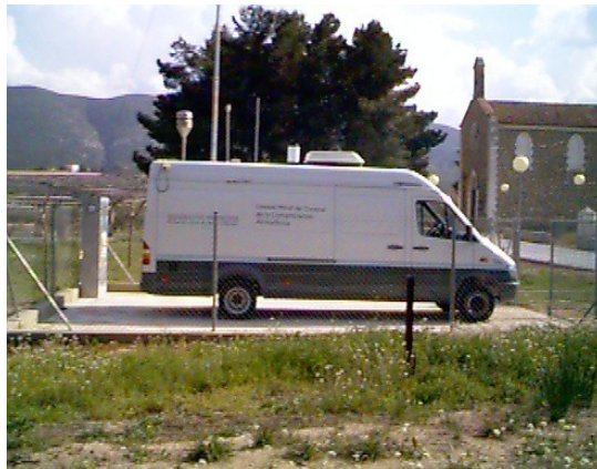
Foto: Unidad Móvil de ONTINYENT

La Red Valenciana de Vigilancia y Control de la Contaminación Atmosférica cuenta con tres unidades móviles y una Unidad de Intervención Rápida, las cuales, obtienen información sobre 11 emplazamientos repartidos en el área interior de la Comunidad Valenciana.