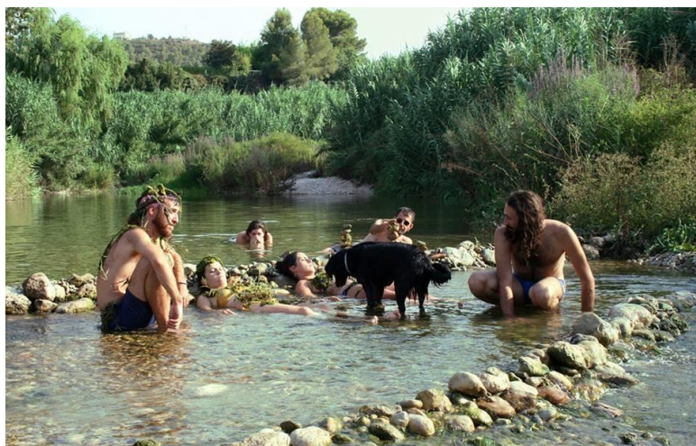
Foto guanyadora del I Concurs fotogràfic Participatiu de la Platja de Potries.