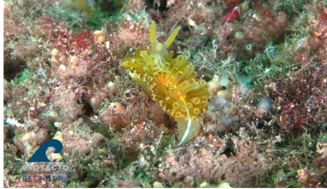
Imagen 2: Antiopella cristata , especie de Opistobranquio presente en Valencia Mar

Se ha observado que al abrigo de esta marina se asientan comunidades muy singulares , con especies animales y vegetales de gran interés ecológico; como diversas especies de Opistobranquios y especies de peces que normalmente se ven asociados a las praderas de Posidonia oceanica ( Chromix chromix , Thalassoma pavo o Serranus scriba ).