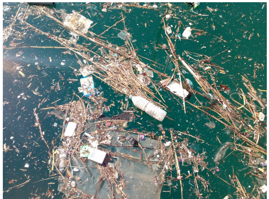
Imagen 3: Acumulación de residuos en Valencia Mar

Esta característica hace que la recogida de plásticos e hidrocarburos sea factible y relativamente sencilla, al mantenerse en la superficie la mayor cantidad de los vertidos.