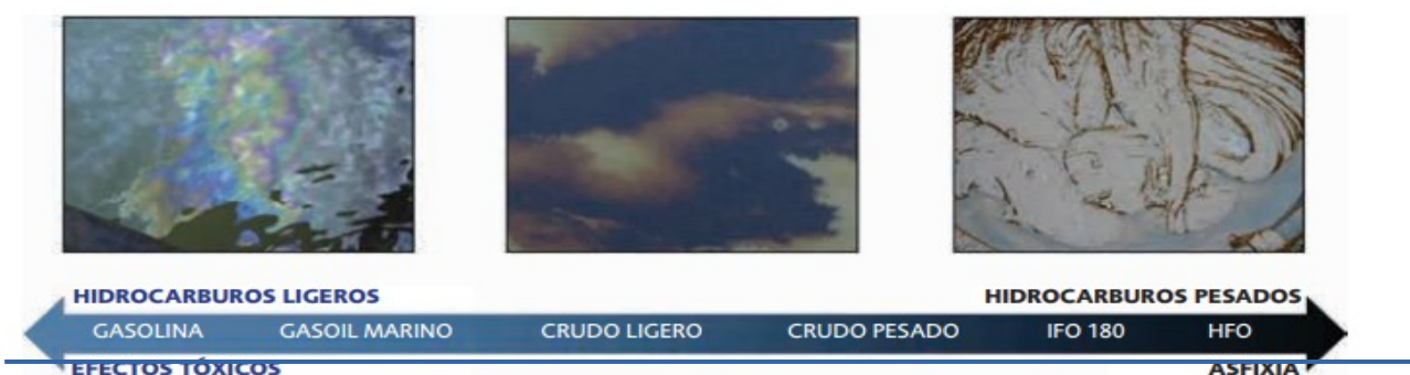
▲ Figura 2: los efectos típicos en los organismos marinos abarcan todo el espectro desde la toxicidad (especialmente para hidrocarburos y productos de petróleo ligeros) hasta la asfixia (fueoils medios y pesados (IFO y HFO) y residuos meteorizados).

Esto provocará una rotura en este equilibrio dinámico, facilitando así el asentamiento de especies oportunistas, bien sean especies autóctonas y/o invasoras.