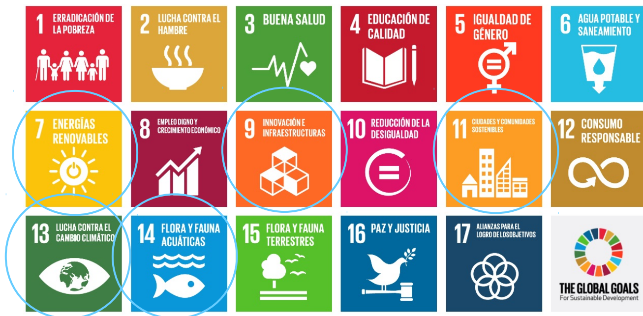
Imagen 4: Objetivos de desarrollo sostenible.

“Blue cleaner” responde a 5 objetivos de desarrollo sostenible: 7, 9, 11, 13 y 14.